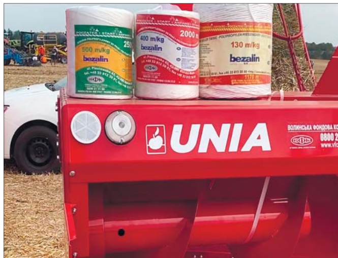
Компанія «BezaLin» є провідним польським виробником поліпропіленового шпагату та сітки для тюкування.

голошує регіональний директор «Волинської фондової компанії».